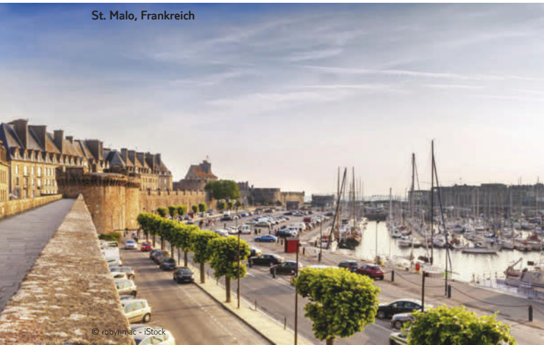
St. Malo, Frankreich