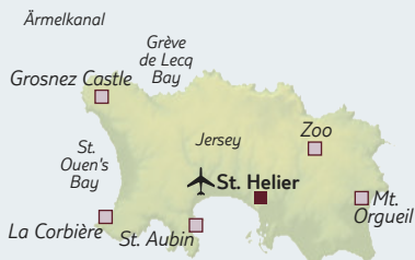
Golf von St. Malo

Reise pro Person ab € 698 Inkl. Flug ab € 933