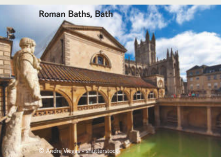
Roman Baths, Bath