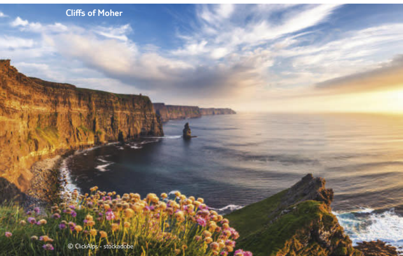
Cliffs of Moher

Änderungen vorbehalten F = Frühstück, M = Mittagessen, A = Abendessen, U = ohne Verpflegung