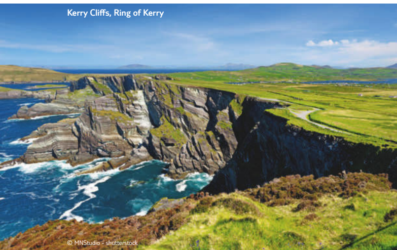
Kerry Cliffs, Ring of Kerry